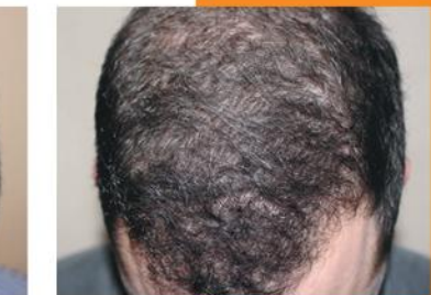
mężczyzna 36 lat 2600 graftów