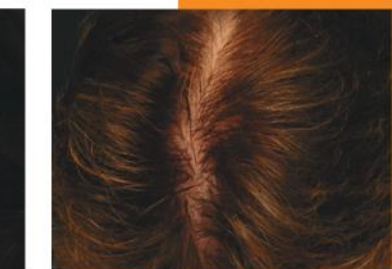
kobieta 58 lat 2000 graftów

„Jestem bardzo zadowolony z wyniku. Bardzo często gdy opowiadam o wykonaniu transplantacji, ludzie pytają mnie o bliźnę. Wtedy pokazuję im, że na mojej głowie nie ma żadnej bliźny, jak to ma miejsce w przypadku tradycyjnego przeszczepu.”